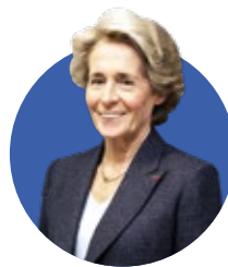
Caroline Cayeux Présidente de l'ANCT